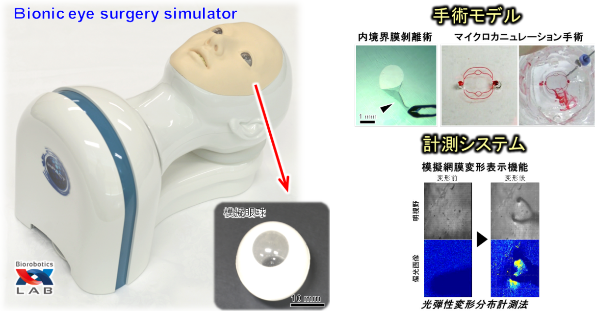
図1 眼科手術シミュレーションシステムの概要 (左) 眼科手術シミュレータの外観と模擬眼球 (右) 現在搭載可能な手術モデルと計測システム