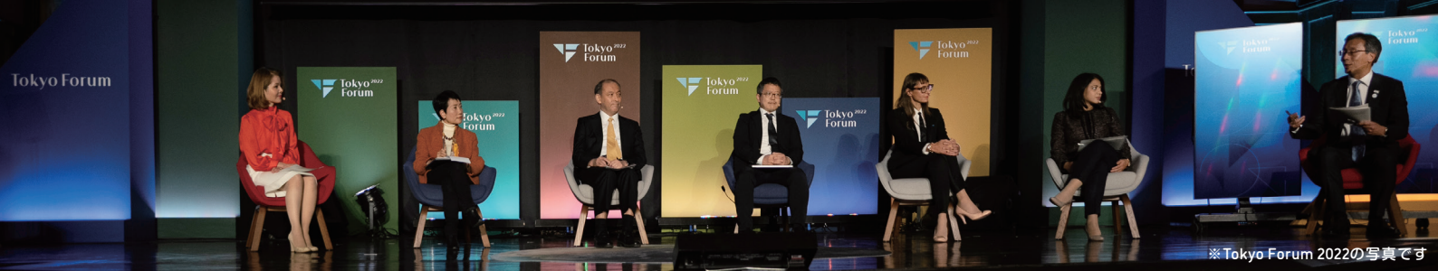
※Tokyo Forum 2022の写真です

今回の東京フォーラムでは、科学技術と人文社会科学の専門知識を結集し、社会的分断とデジタル革新が渦巻く中で人類は地球規模の課題とどう向き合っていくかを探求します。