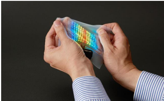
写真 1: 薄型で伸縮自在なフルカラースキンディスプレイ。独自の伸縮性ハイブリッド電子実装技術で、12×12個のカラーLEDと伸縮性配線をゴムシートに実装した。

国立大学法人東京大学(総長:五神真)の染谷隆夫博士(大学院工学系研究科長・教授)の研究チームと大日本印刷株式会社(以下:DNP)は、独自の伸縮性ハイブリッド電子実装技術(用語 1)を進化させ、薄型で伸縮自在なフルカラーのスキンディスプレイ(用語 2)と駆動・通信回路及び電源を一体化した表示デバイスの製造に成功しました(写真 1、2)。この装置は、皮膚上に貼り付けたディスプレイに外部から送られた画像メッセージを表示できるコミュニケーションシステムです。