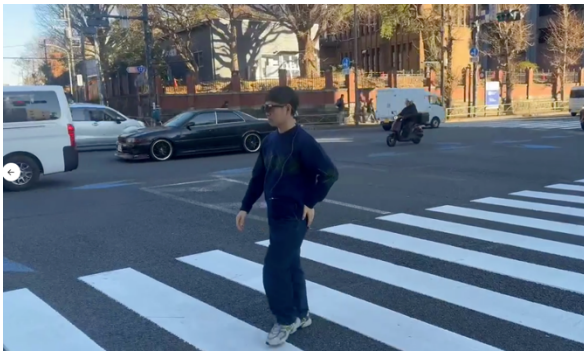
図 3.1. AR グラスをかけての実証の様子

次に、事前評価の結果を踏まえ、本実証において提案技術を適用した構成の評価を行いました。その結果、通信量及び計算負荷が抑制され、動画全体を通じて E2E 遅延をほぼ一定に維持できることが確認されました。また、処理待ち時間が累積的に増大する傾向は認められませんでした。さらに、提案技術の適用による AI の推論精度の低下も確認されませんでした。以上より、提案技術は、リアルタイム性が要求される本ユースケースにおいて、AI の推論精度を維持したまま E2E 遅延を安定的に低減できることを示しました。