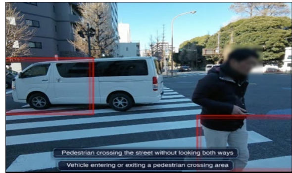
図 3.2. AR グラスの画面