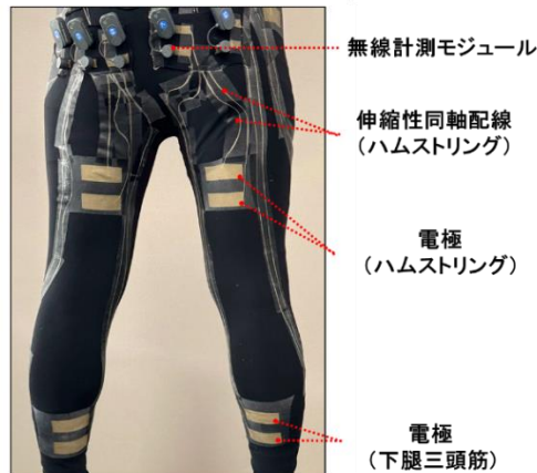
下半身型無線筋電図計測スマート衣服