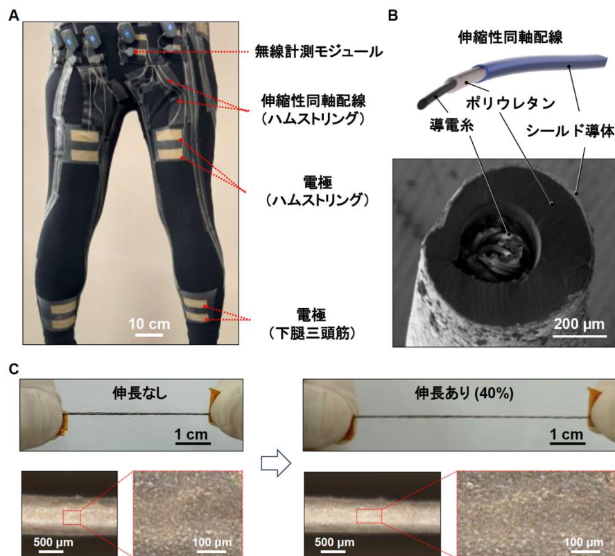
図 1 衣服型の無線筋電図計測システム

伝導性を付与するため銀の断片である銀フレークと、フッ素系ゴムから成る伸縮性導体インクを浸漬（しんせき）工程でコートすることで、3層構造の配線を作製しました。このシールド導体は、伸縮時にも亀裂が入らず信号線が外部に露出することを防ぎ（図 1C）、80%伸長時においても電気抵抗は 60\Omega （ \Omega ：オーム。電気抵抗の単位）以下であり、十分な導電性を保持することが確認されました。その結果、このシールド構造により配線への外部ノイズ混入を大幅に抑制できました。特に、通常は大きなノイズ源となる他者との物理的な接触時でも、ノイズレベルが変動しないことを確認しました。