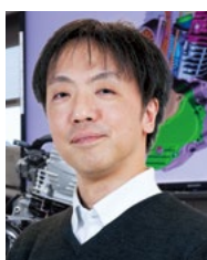
大竹 豊 教授